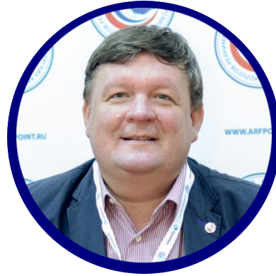
Константин Николаевич Золотухин