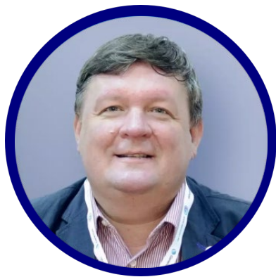
Константин Николаевич Золотухин