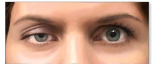
Ptosis (párpado caído)

Редкие формы: детская миастения, ювенильная миастения, миастения с туловищной слабостью, миастения в сочетании с коллагенозами, миастения в сочетании с аутоиммунными заболеваниями, миастения с атрофиями